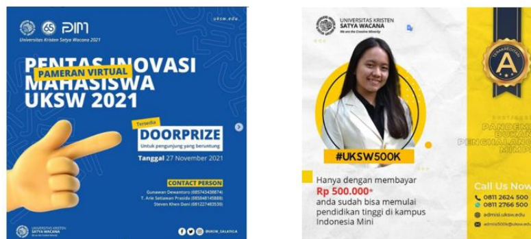
Gambar 3. Promosi

Untuk menarik dan mempertahankan minat calon mahasiswa, UKSW Salatiga menjalankan berbagai strategi promosi, di antaranya: 1) Menyelenggarakan beragam acara, seperti webinar, seminar dengan pembicara eksternal, serta tur kampus virtual yang diperuntukkan bagi calon mahasiswa baru. 2) Menawarkan insentif berupa potongan harga atau cashback sebesar Rp 500.000 bagi pendaftar jalur prestasi (Pemamik) pada periode tertentu, serta diskon 50% untuk biaya pendaftaran bagi mereka yang mendaftar melalui event Expo/Edufair di stand UKSW. 3) Terus memperluas jaringan fasilitator alumni di seluruh Indonesia, yang berperan aktif dalam menyebarkan informasi terkait proses admisi UKSW. Strategi promosi ini memanfaatkan keunggulan (strengths) dan peluang yang dimiliki universitas, seperti partisipasi dalam expo pendidikan yang menonjolkan kelebihan UKSW. Selain itu, merespons tantangan pandemi Covid-19, UKSW juga menawarkan program studi dengan biaya kuliah yang lebih terjangkau untuk membantu calon mahasiswa.