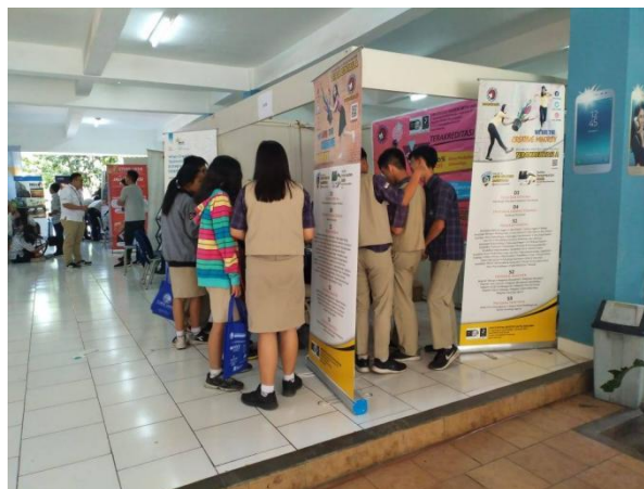
Gambar 4. Kegiatan Expo/Edufair Perguruan Tinggi

UKSW Salatiga menerapkan strategi penjualan personal dengan berbagai pendekatan, di antaranya: 1) Melakukan kunjungan langsung (door to door) ke institusi pendidikan serta lembaga keagamaan, seperti gereja Kristen dan Katolik, untuk memperkenalkan UKSW secara lebih dekat. 2) Mengadakan presentasi langsung oleh Satya Wacana Promotion Team di sekolah-sekolah, gereja, serta dalam event expo atau edufair yang diselenggarakan oleh berbagai institusi. Dengan cara ini, calon mahasiswa mendapatkan informasi yang lebih rinci dan mendalam mengenai UKSW, memungkinkan mereka untuk lebih memahami keunggulan yang ditawarkan oleh universitas tersebut.