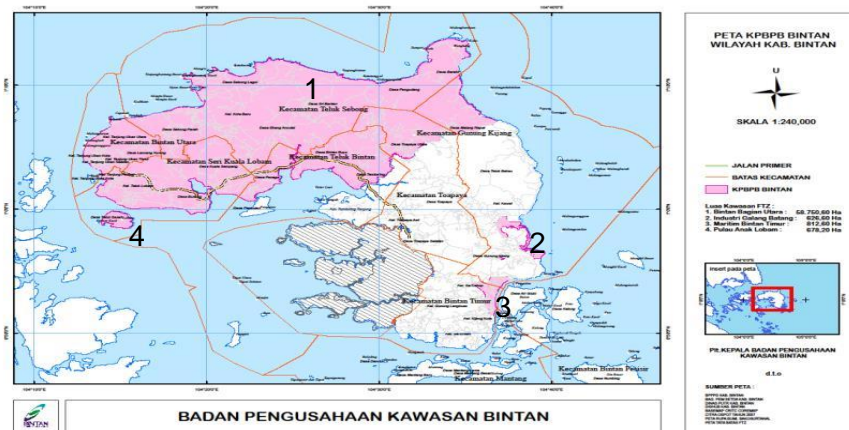
Gambar 1 Peta Kawasan FTZ Bintan Wilayah Kabupaten Bintan