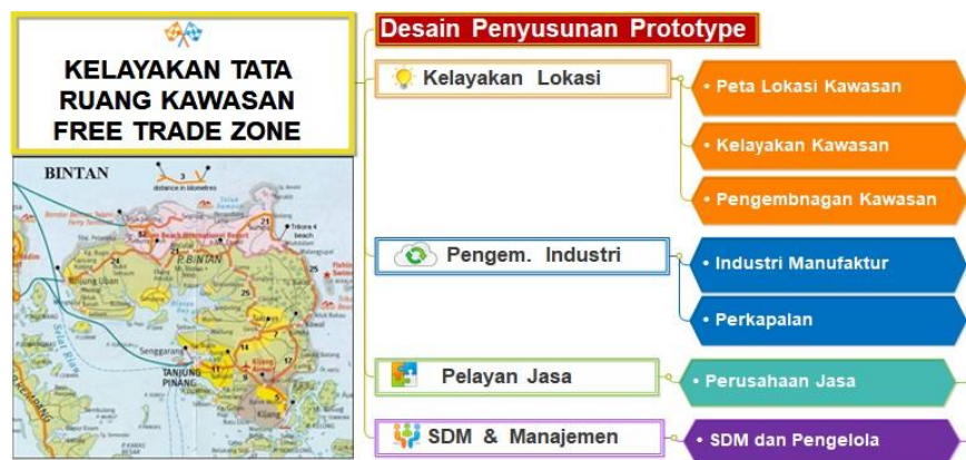
Gambar 2 Desain Penyusunan Kelayakan Tata Letak FTZ

Solusi dan penyelesaian permasalahan diatas, kami Menyusun grand profolio untuk Pengembangan kelayakan tata ruang kawasan free trade zone dalam meningkatkan daya tarik investor di Kabupaten Bintan seperti gambar dibawah ini.